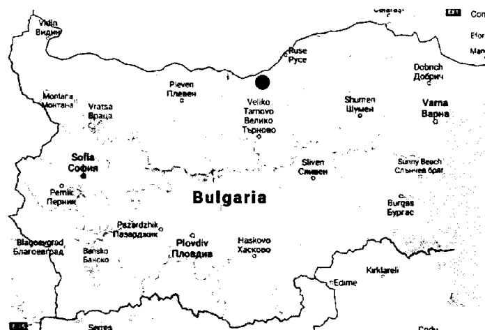
Фигура 3 Разположение на Община Ценово на територията на Република България

Като предимство на географското разположение на Община Ценово, може да се изтъкне близостта ѝ до реките Дунав и Янтра, както и характерните за Дунавската хълмиста равнина – добре залесени или терасирани територии и наличието на плодородни земи.