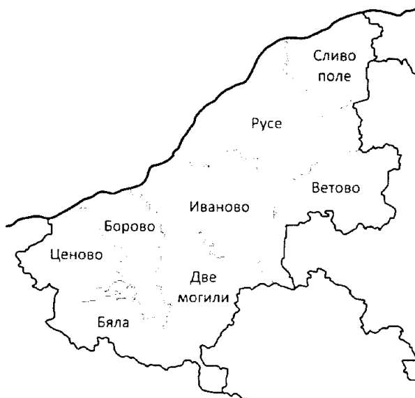
Фигура 1 Разположението на Община Ценово на територията на Област Русе

Община Ценово е разположена в централната част на северна България – в Средна Дунавска равнина – и е част от западната граница на Русенска област. Това е и район за трансгранично въздействие с установени връзки с румънски общини. Общинският център – с. Ценово – е на разстояние на около 45 км югозападно от гр. Русе и на 32 км от гр. Свищов 2 .